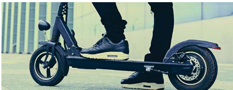
La normativa se aplica a los patinetes eléctricos y a otros vehículos de movilidad personal (VMP).

AVISO Se recuerda a los usuarios que está prohibido circular por aceras, paseos y zonas peatonales