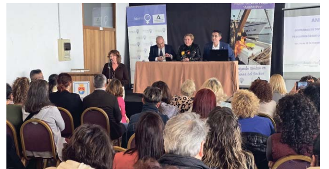
Momento de la inauguración de las jornadas en la Lonja Vieja.

N.P. | La Lonja Vieja ha acogido durante los días 21 y 22 de febrero las Jornadas de Diversificación del Sector Pesquero desde una Perspectiva de Género, organizadas por la Asociación AndMuPes y subvencionadas por la Junta de Andalucía.