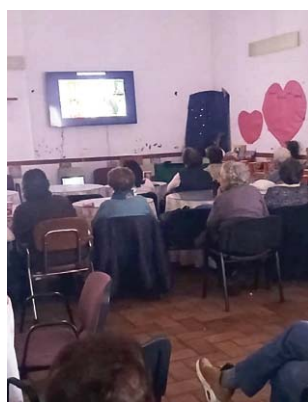
Sesión de cine en el CPA.

Esta actividad, enmarcada dentro del programa 'Martes de Cine', tiene como objetivo fomentar el ocio y la sociali-