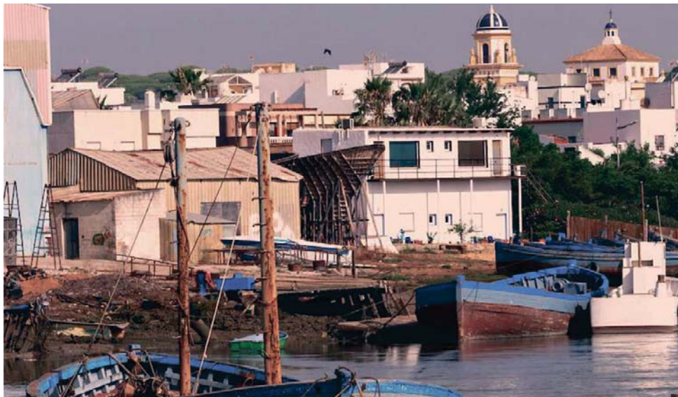
Hoy se aprueba en el Pleno el Plan de Acción Integral con proyectos que se presentarán a los fondos FEDER.

Además, se impulsará la modernización de infraestructuras deportivas y cultu-