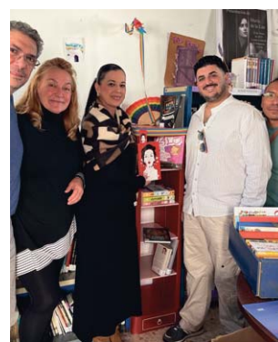
Momento de la donación del libro.

con una amplia selección de libros en árabe, abarcando desde clásicos de la literatura hasta obras contemporáneas, además de libros infantiles, de poesía y textos educativos.